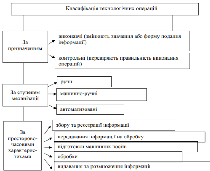
Рис. 2. Класифікація технологічних операцій в бухгалтерському обліку.