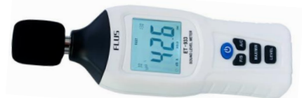
Рисунок 3 – Прилади для вимірювання рівня шуму (шумомір)

1. Виконати захист практичного заняття та представити результати вимірювань рівнів шуму.