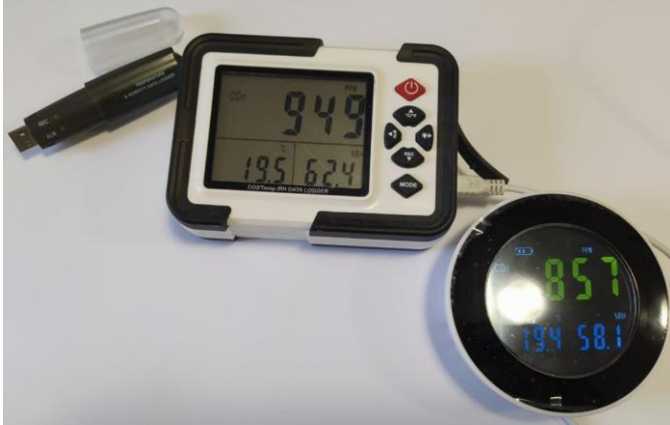
Рисунок 1 – Прилади для вимірювання параметрів мікроклімату

1. Виконати захист практичного заняття та представити результати вимірювань параметрів мікроклімату.