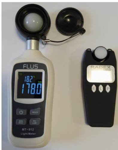
Рисунок 2 – Прилади для вимірювання освітлення (люксметр)