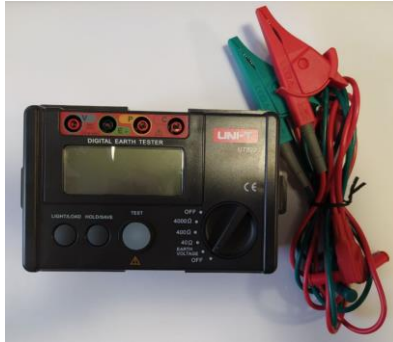
Рисунок 4 – Цифровий вимірювач опору заземлення (UT522)