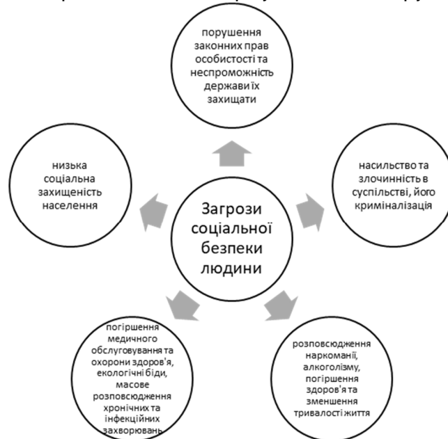
Рис. 2. Джерела загроз соціальній безпеці людини

реалізацію життєво важливих інтересів особи, суспільства та держави для забезпечення стійкого і прогресивного розвитку країни [18]. Загрози соціальної безпеки представляють собою явища та процеси, які спричиняють раптові, а часом і суттєві зміни в способі життя, порушують життєво важливі соціальні права та інтереси особи. Джерела таких загроз можна класифікувати на такі групи (рис. 2).