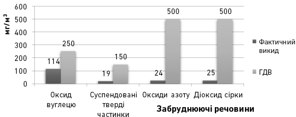
Рис. 2. Порівняльна характеристика фактичних викидів забруднюючих речовин в атмосферне повітря із джерела 14 з ГДВ

Порівняльну характеристику фактичних викидів забруднюючих речовин в атмосферне повітря із джерела 14 з ГДВ представлено на рис. 2.