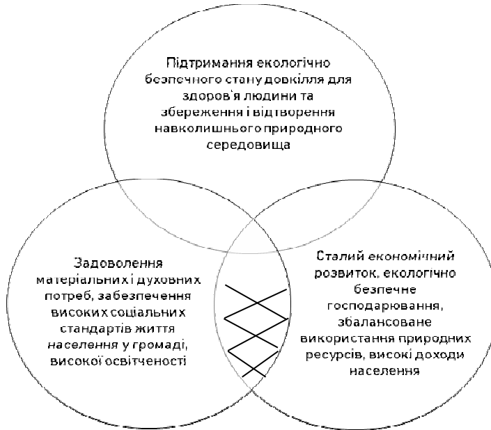
Рис. 2. Пріоритети забезпечення досягнення Стратегічного бачення Городоцької СР