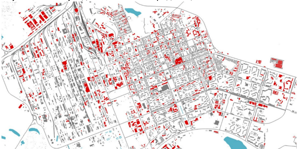
Рис. 1. Карта пожеж внаслідок обстрілів м. Сєвєродонецьк

Залишковий ресурс об'єкта відновлення впливає на рішення щодо доцільності його відновлення або реконструкції. Необхідно визначати рівні та категорії об'єктів відбудови. Це складне методологічне завдання. Однією з умов доцільності відновлення об'єкта є здатність забезпечити певну функцію містобудівної діяльності. На рис. 1 наведено карту пожеж внаслідок обстрілів у м. Сєвєродонецьк. Рис. 2 демонструє знімок інтерактивної карти влучань по місту під час боїв за Сєвєродонецьк.