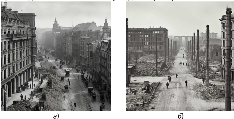
Рис. 1. Міста Європи після війни: а) після першої світової війни; б) після другої світової війни

Королівський палац, або Королівський лазні, було відновлено відповідно до оригінальних планів. Також було відновлено міську інфраструктуру, зокрема трамвайні мережі та станції метро. Варшава повернула свою роль як культурний та економічний центр Польщі, і зараз є одним з найбільших міст у Східній Європі (рис. 1).