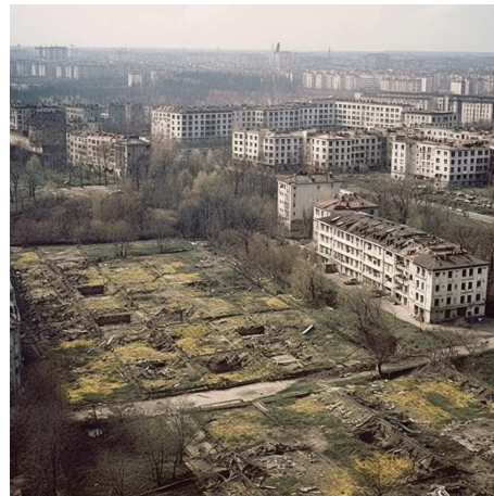
Рис. 2. Зруйновані міста України

Архітектурні підходи до відновлення міста включають в себе різні аспекти, важливі для створення безпечного, комфортного та ефективного міського середовища. Вибір архітектурного стилю, використання відповідних матеріалів та сучасних технологій, а також урахування інженерних рішень та реконструкція громадських просторів – це лише деякі з аспектів, які необхідно враховувати під час відбудови міста.