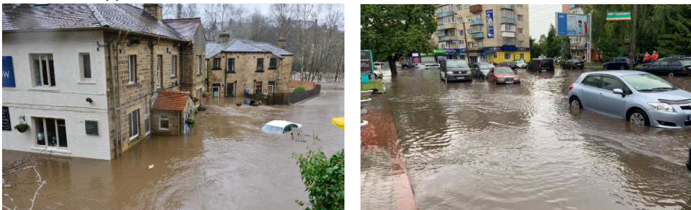
Рис. 1. Затоплення міських територій у місті Рівному

Україна є країною з високим рівнем опадів, особливо на заході та півдні. Досвід показує, що після тривалих або інтенсивних дощів у понижених місцях міських територій накопичуються значні об'єми поверхневих вод (рис. 1). Наявність систем дощового водовідведення не гарантує уникнення підтоплень і затоплень міських територій [4; 5; 6]. На понижених ділянках може мати місце зворотній ефект – затоплення територій через роботу колекторів водовідведення у напірному режимі із виливом стічних вод через дощоприймачі та люки колодязів [5].