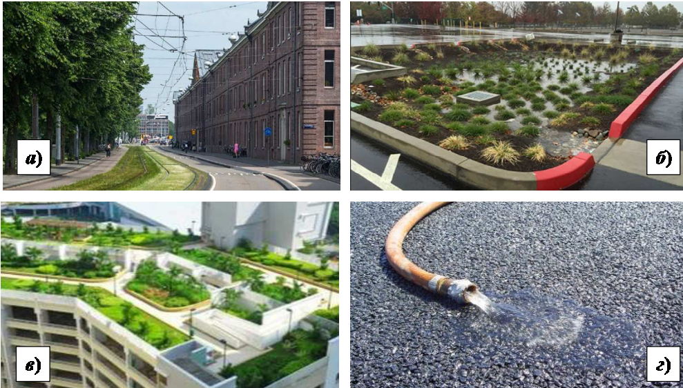
Рис. 3. Споруди фільтрувальних методів регулювання дощових стоків: а) газони і рослинні смуги; б) інфільтраційні басейни; в) «зелені» дахи; г) пористий асфальт

Для визначення ефективності методів регулювання дощового стоку визначено сім критеріїв їхнього оцінювання [5–8]: