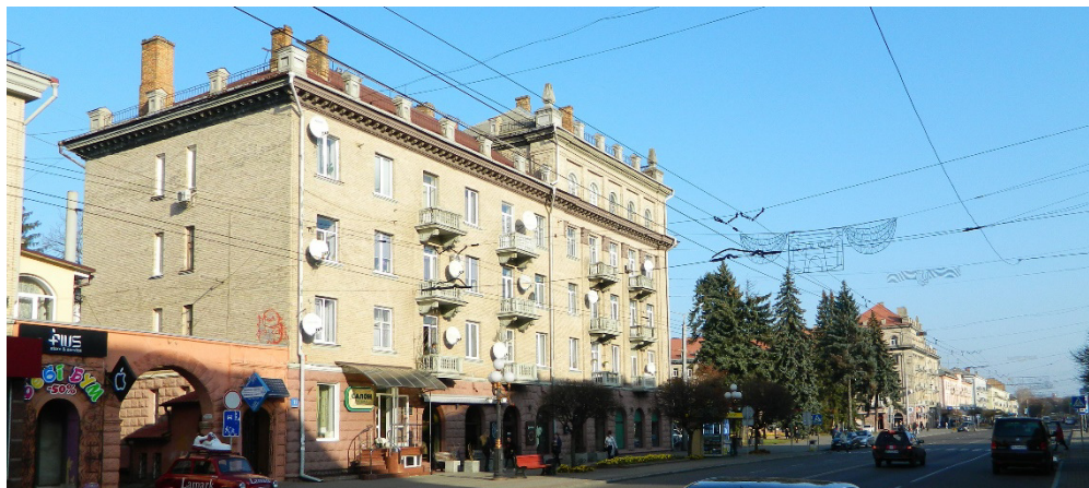
Рис. 2. Житлові будинки, Луцьк, Проспект Волі, 11 та 15

Взірець житлового будинку з «вежею» на наріжній ділянці у Рівному – триповерховий житловий будинок з ротондою на даху, за адресою вул. Соборна, 262 (рис. 3). Будинок зведений за індивідуальним проєктом (арх. – Б. Андрєєв). Будівлю завершує декоративний ліхтар у вигляді ротонди з колонами [6, С. 118]. Цей будинок є архітектурним акцентом кварталу, який окреслюють вул. Соборна, вул. Базарна, вул. Гетьмана Полуботка та вул. Пересопницька. Окрім названого будинку, до складу кварталу ввійшли збудовані у 1945–1950-х рр. триповерхові житлові будинки за адресами вул. Соборна, 260 та вул. Базарна, 8, а також збережені будівлі довоєнного періоду.