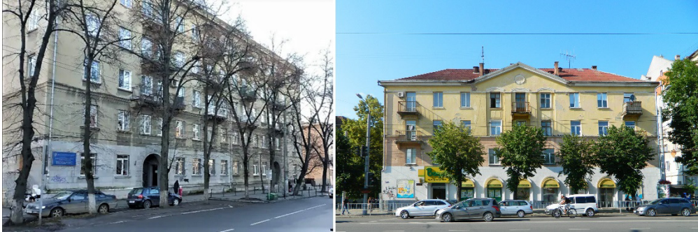
Рис. 6. Житлові будинки, Івано-Франківськ, вул. Вовчинецька, 4 та вул. Незалежності, 81

Чотириповерховий житловий будинок за адресою вул. Незалежності, 81 має симетричне П-подібне планувальне рішення. На торцях містяться еркери. Також яскраве втілення характерних стилістичних рис радянського неоісторизму представляє п'ятиповерховий будинок за адресою вул. Вовчинецька, 4 (рис. 6).