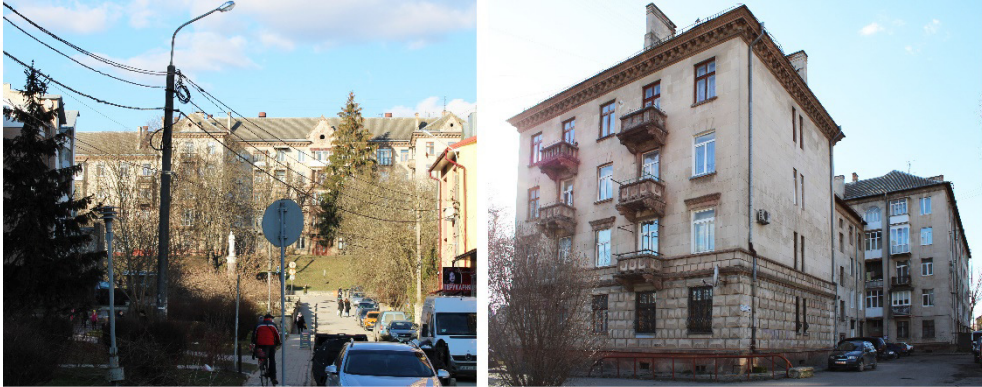
Рис. 1. Житловий будинок, Тернопіль, вул. Князя Острозького, 39/45