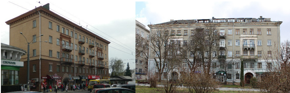
Рис. 4. Втілення житлового будинку за типовим проєктом у Рівному (вул. Соборна, 135) та Тернополі (вул. Чорновола, 2)

За проектом повторного застосування в другій половині 1950-х рр. у Рівному зведено «парадний» за своїм архітектурним рішенням п'ятиповерховий житловий будинок за адресою вул. Соборна, 135. За цим же проектом було споруджено житловий будинок у Тернополі (вул. Чорновола, 2), який увійшов до центрального архітектурного ансамблю міста. Втілення проєкту у Рівному та Тернополі мають незначні відмінності в декоруванні та опорядженні фасадів (рис. 4).