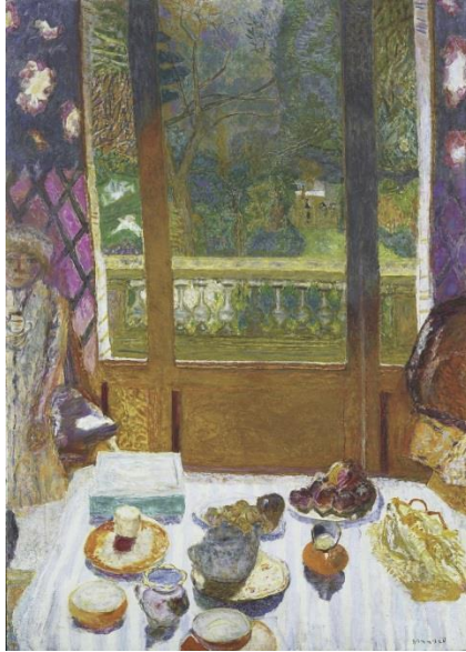
П'єр Боннар «Обідня кімната», 1930-1931 рр.

Наприклад: «У кутку живописного полотна можна побачити ледь помітний контур жінки на тлі сітчастого фону. Невиразність її присутності є необхідною, як зазначав Боннар в одному зі своїх записів, бо: «Фігура має бути частиною фону, на якому вона розміщена».