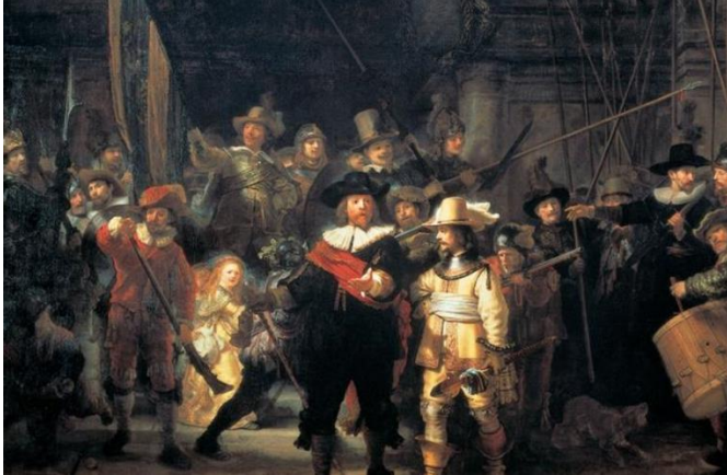
Рембрандт Гарменс ван Рейн «Нічна варта» , 1642 р.