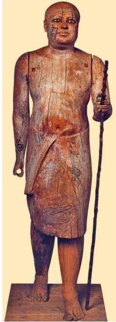
Статуя Ка-апера, с. III тис. до н.е.