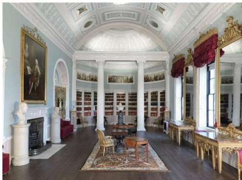
Robert Adam, Kenwood: Library (1767-1769)

також тому, що зала симетрична, геометрична і ретельно збалансована».