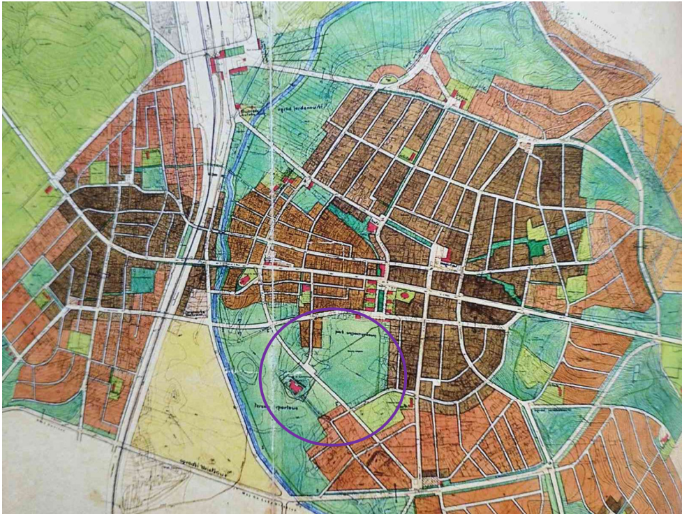
Рис. 4. Генеральний план м. Рівне 1936 р. Конкурсний проєкт № 7. Архітектори М. Буцкевічувна, В. Вечоркевич. Виділено локалізацію палацово-паркового комплексу князів Любомирських та прилеглу територію, яка підлягала благоустрою відповідно до пропозицій генерального плану [2, С. 30]

Авторка в контексті розгляду генплану 1936 року також подає детальний опис проєктної ландшафтно-рекреаційної зони, яка була значною за протяжністю і формувалася вздовж русла р. Усті (рис. 4).