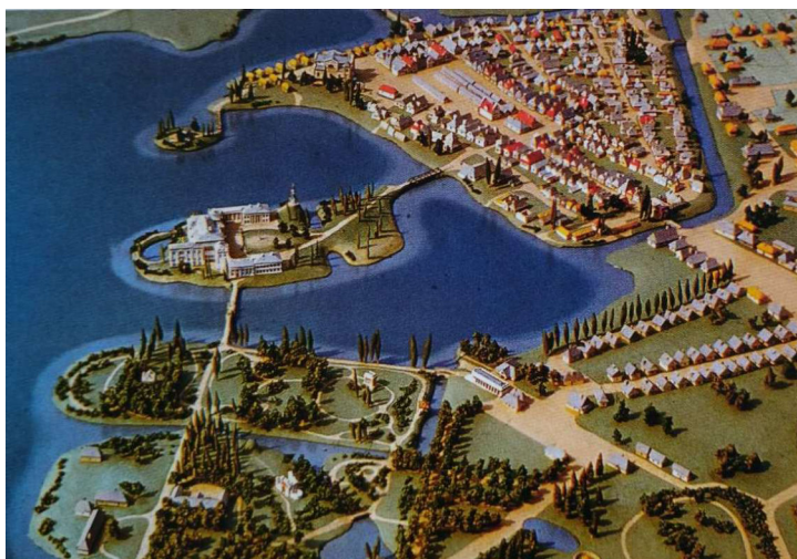
Рис. 1. Фото макету Ричкова П. Садово-паркова зона, замковий острів і середмістя. Вигляд з південного сходу [8, С. 180]

На цьому унікальному документі відтворено своєрідний палацово-парковий ансамбль міста Рівного, початки якого пов'язані з XV століттям, доба найвищого розквіту припала на другу половину XVIII століття, а занепад і повне зникнення – на першу половину XX століття. В контексті дослідження автор приділяє увагу також тогочасним ландшафтно-рекреаційним об'єктам поселення, завдяки чому відкривається найцікавіша, за словами Ричкова П., сторінка в історії міста Рівного – створення однієї з найбільших палацово-паркових резиденцій на території Речі Посполитої. Потрібно додати, що на основі цього плану автор майже 30 років тому змодельював архітектурно-урбаністичний макет міста Рівного станом на кінець XVIII століття, який також дуже детально демонструє природно-ландшафтні особливості поселення того періоду [8, С. 6–7] (рис. 1, 2).