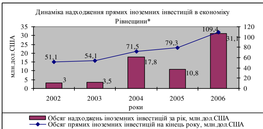
Рис.2. Динаміка надходження прямих іноземних інвестицій в економіку Рівненщини

збуту якої є країни ЄС. Значні суми інвестицій (9 млн.дол.США), вкладені англійською фірмою „Alperton Promotion Ltd” в ТзОВ „КАМАЗ-Транс-Сервіс”, що дали можливість замінити вантажні автомобілі підприємства на такі, які відповідають європейським стандартам екобезпеки, а також вкладено інвестиції (2 млн.дол.США) в ТзОВ “Інформаційно-експедиційна компанія”, яка надає допоміжні транспортні послуги. Литовською фірмою „Мілса” у розвиток Селищанського гранкар’єру (Сарненський район) залучено інвестицій на суму 2,7 млн.дол.США, що дало можливість суттєво збільшити обсяг виробництва щебеневіої продукції. За 2006 р. вироблено продукції на загальну суму 16,3 млн.грн., що на 24,5% більше 2005 р. Холдингом акціонерним товариством „Midicon Holding S.A.” (Люксембург) вкладено інвестиції на суму 2,2 млн.дол.США в ТзОВ „Рівненський насіннєвий завод”.