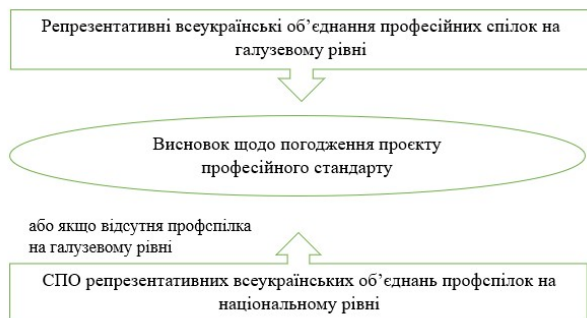
Рис. 2. Підготовка професійною спілкою висновку щодо погодження проєкту професійного стандарту

Для погодження проєкту професійного стандарту розробник (якщо це не галузева рада з питань розроблення професійних стандартів) надсилає його до відповідної професійної спілки, яка перевіряє його та формує відповідний висновок, у разі їх відсутності – СПО профспілок (рис. 2).