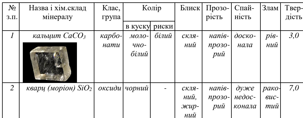
Приклад таблиці для описання мінералів за фізичними властивостями