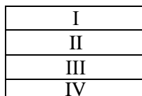
Рис 2. Конструкція дорожнього одягу (I-IV номера шару)

Студент обирає конструкцію дорожнього одягу з чотирьох шарів (рис. 2).