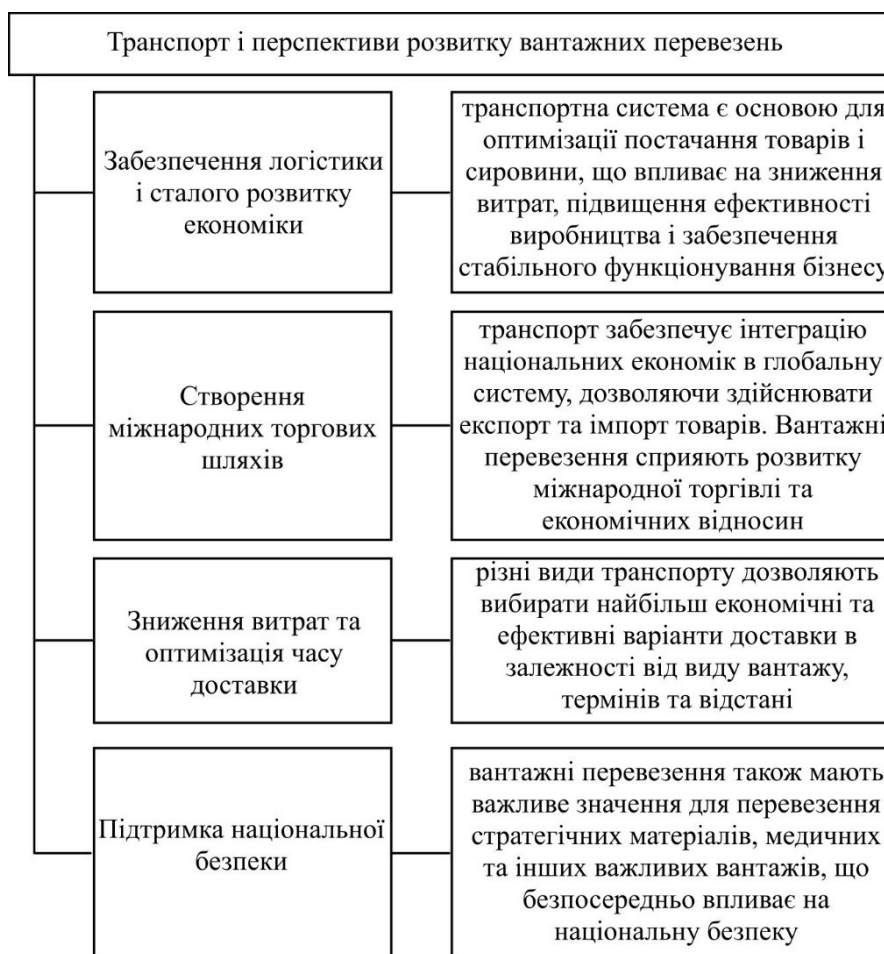
Рис. 4. Роль транспорту для вантажних перевезень

безумовно вважається автомобільний транспорт, який дозволяє доставляти товари безпосередньо до кінцевих споживачів або між підприємствами, зберігаючи гнучкість у виборі маршрутів (рис. 4).