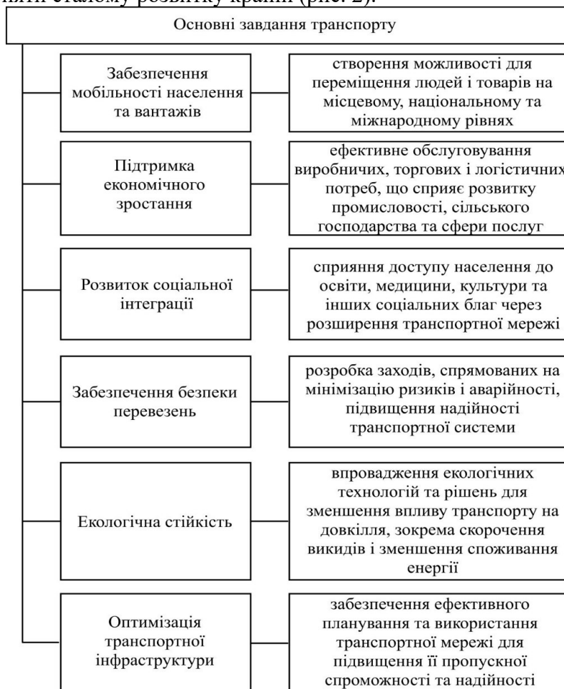
Рис. 2. Транспорт та його народногосподарське значення

У контексті транспорту завдання можуть стосуватися забезпечення ефективності перевезень, зниження витрат, підвищення безпеки чи впровадження нових технологій для покращення транспортної інфраструктури і дозволяють підтримувати соціально-економічну стабільність і сприяти сталому розвитку країни (рис. 2).