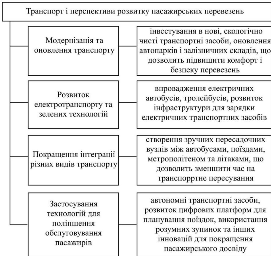
Рис. 3. Роль транспорту для пасажирських перевезень

Пасажирські перевезення в Україні є важливою складовою соціальної та економічної інфраструктури, що вимагає подальшої модернізації та вдосконалення для забезпечення ефективного, безпечного та екологічного транспортного обслуговування населення (рис. 3).