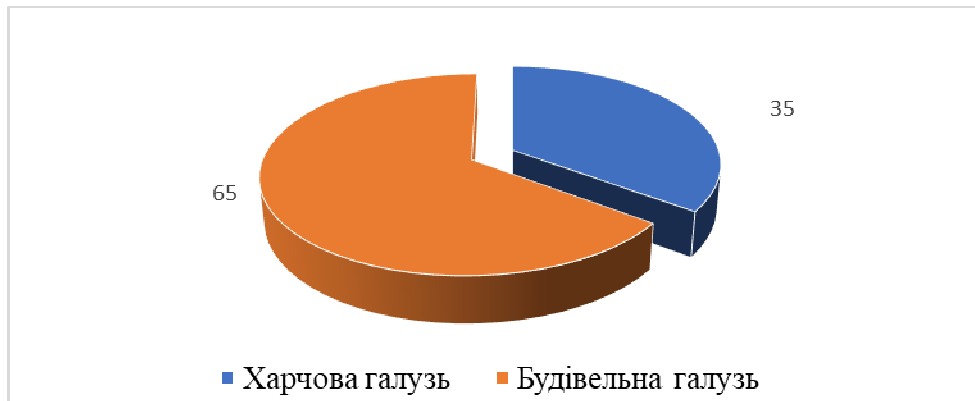
Рис. 3. Структура вантажних перевезень автомобільним транспортом ТОВ «Будтранс Сарни» за галузевою приналежністю

ТОВ «Будтранс Сарни» здійснює перевезення вантажів як на території України, так і в міжнародному сполученні. За кордон перевозиться харчова продукція, а по Україні будівельні вантажі, структуру перевезень вантажів по галузях можна побачити на діаграмі (рис. 3).