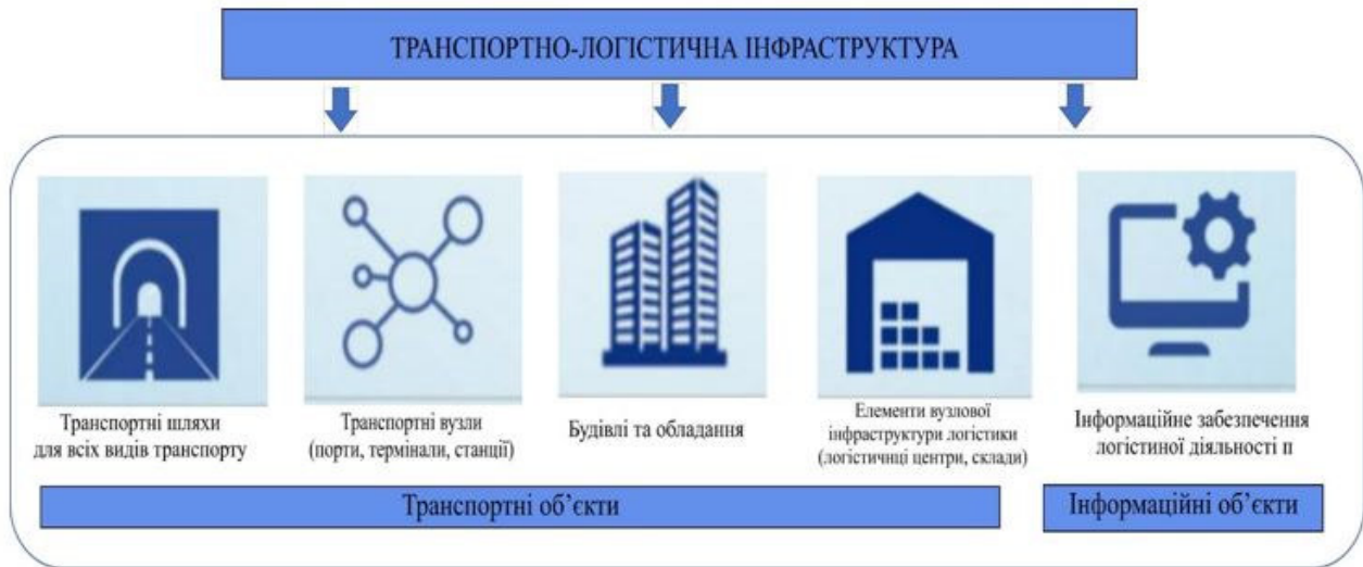
Рис. 1. Основні компоненти та складові транспортно-логістичної інфраструктури

Регіональні логістичні мережі складаються з транспортної, комунікаційної, складської інфраструктури та учасників, таких як виробники, постачальники, дистриб'ютори і споживачі. Транспортна інфраструктура включає дороги, залізничні шляхи, порти та аеропорти, які забезпечують переміщення товарів між різними точками. Склади та термінали служать як місця для зберігання продукції, що дозволяють ефективно управляти запасами та забезпечують швидкий доступ до товарів. Інформаційні технології, зокрема системи управління ланцюгами постачання (SCM), здійснюють обробку та аналіз даних для покращення процесів. Учасники цієї мережі – це виробники, постачальники, дистриб'ютори, роздрібні торговці та кінцеві споживачі, які взаємодіють у межах логістичних операцій (рис. 1).