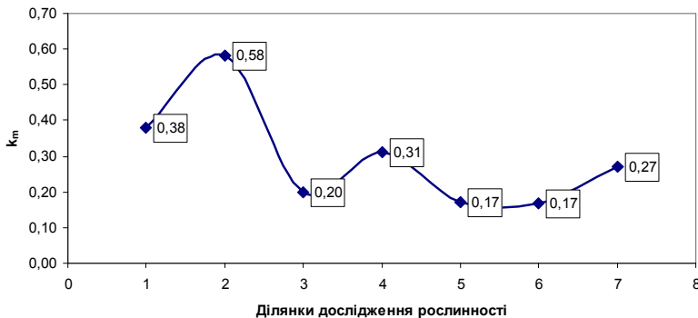
Рис. 3. Профіль річки Устя за значенням біотичного коефіцієнта

Для порівняння результатів оцінки за гідрохімічними показниками та біотичним коефіцієнтом ( k_m ) ми використали дані про водойму з найкращою якістю води – о. Біле (Володимирецький р-н). За даними 2013 р., біотичний коефіцієнт за судинними макрофітами для озера становив 0,89 (стан водного середовища добрий).