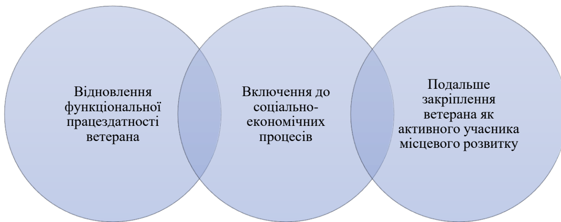
Рис. 1 Трирівнева модель активної реінтеграції ветеранів як суб'єктів сталого розвитку, авторська розробка.

У контексті сталого розвитку суспільства доцільно перейти до моделі активної реінтеграції, у межах якої ветеранська політика поєднує три взаємопов'язані блоки.