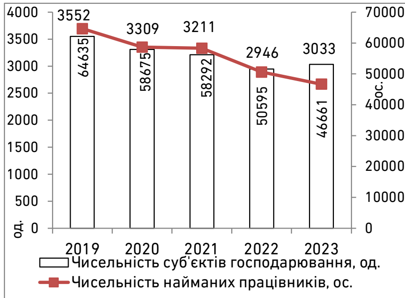
Рис. 2. Чисельність суб'єктів господарювання та найманих працівників у лісовому господарстві та лісозаготівлях за 2019–2023 рр.

Кількість суб'єктів господарювання у лісовому секторі протягом 2019–2023 рр. має тенденції до скорочення: з 3552 од. у 2019 р. до 3033 од. у 2023 р. Це свідчить про певне звуження підприємницького середовища, що може бути наслідком економічних криз та структурних реформ у галузі. Чисельність найманих працівників знизилася ще відчутніше – з 64,4 тис. ос. у 2019 р. до 46,7 тис. ос. у 2023 р. (на 28%). Така динаміка вказує на скорочення кадрового потенціалу, що може мати як економічні, так і демографічні чи міграційні причини. Найбільш відчутне падіння чисельності працівників спостерігалось у 2020–2022 рр., що співпадає з періодом воєнних дій (початком повномасштабного вторгнення) і пандемії COVID-19, та пов'язаних із цим логістичних і фінансових обмежень. Незважаючи на скорочення кількості суб'єктів господарювання та працівників, зростання рентабельності, яке представлено на рис. 1, свідчить про зміщення акценту на підвищення ефективності діяльності та їх адаптацію до нових економічних реалій через оптимізацію ресурсів і виробничих процесів. Загалом така динаміка може вказувати на перехід галузі від екстенсивної моделі розвитку до більш інтенсивної, що зорієнтована на ефективне використання підприємницького потенціалу та конкурентних переваг.