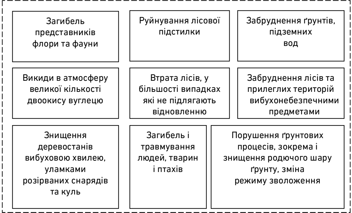
Рис. 2. Проблеми і наслідки, які виникли через запроваджений воєнний стан, для суб'єктів лісового господарства і власне лісів