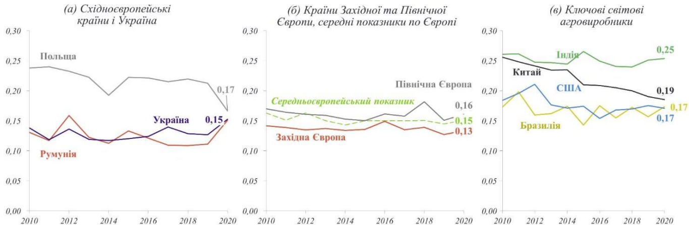
Рис. 2. Середні показники викидів парникових газів