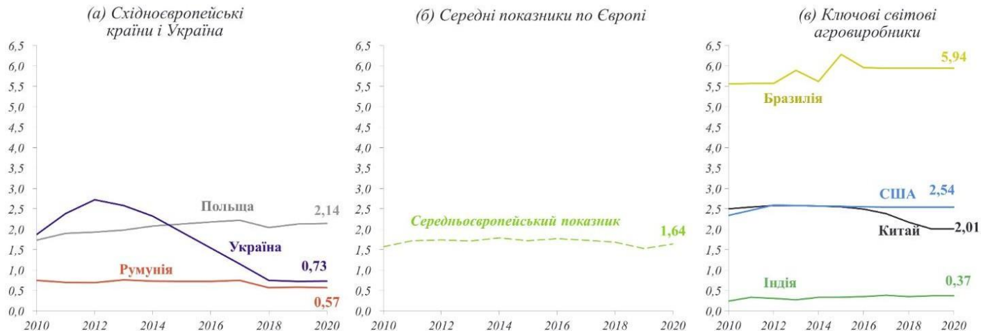
Рис. 2. Середні показники внесення пестицидів