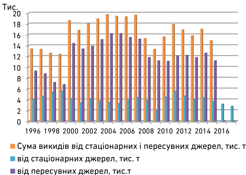
Рис. 1. Динаміка викидів забруднюючих речовин в атмосферне повітря

Середньорічна концентрація оксиду вуглецю сягає значень 0,7–1,0 ГДК, а максимальні разові концентрації оксиду вуглецю фіксуються у літні місяці, які змінюються в межах від 2,0 до 2,4 ГДК (ГДК мр = 5 мг/м 3 ).