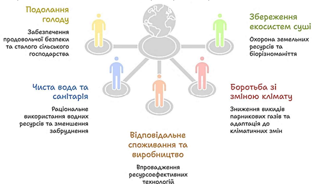
Рис. 1. Зв'язок органічного виробництва з Цілями сталого розвитку

Не менш важливим є внесок органічного виробництва у реалізацію ЦСР 15 «Збереження екосистем суші», яка передбачає охорону земельних ресурсів, збереження біорізноманіття та відновлення деградованих екосистем. Органічне господарювання сприяє відновленню природних екосистем, підвищенню біологічного різноманіття та зменшенню деградації ґрунтів, що є важливим фактором екологічної стійкості територій [5] (рис. 1).