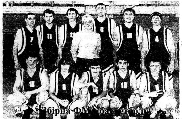
Збірна ФМ у баскетболі

У запеклій боротьбі команда ФМ перемогла МЕФ з рахунком 100:55, а команда ФЗГ команду ФПМ з рахунком 83:69.