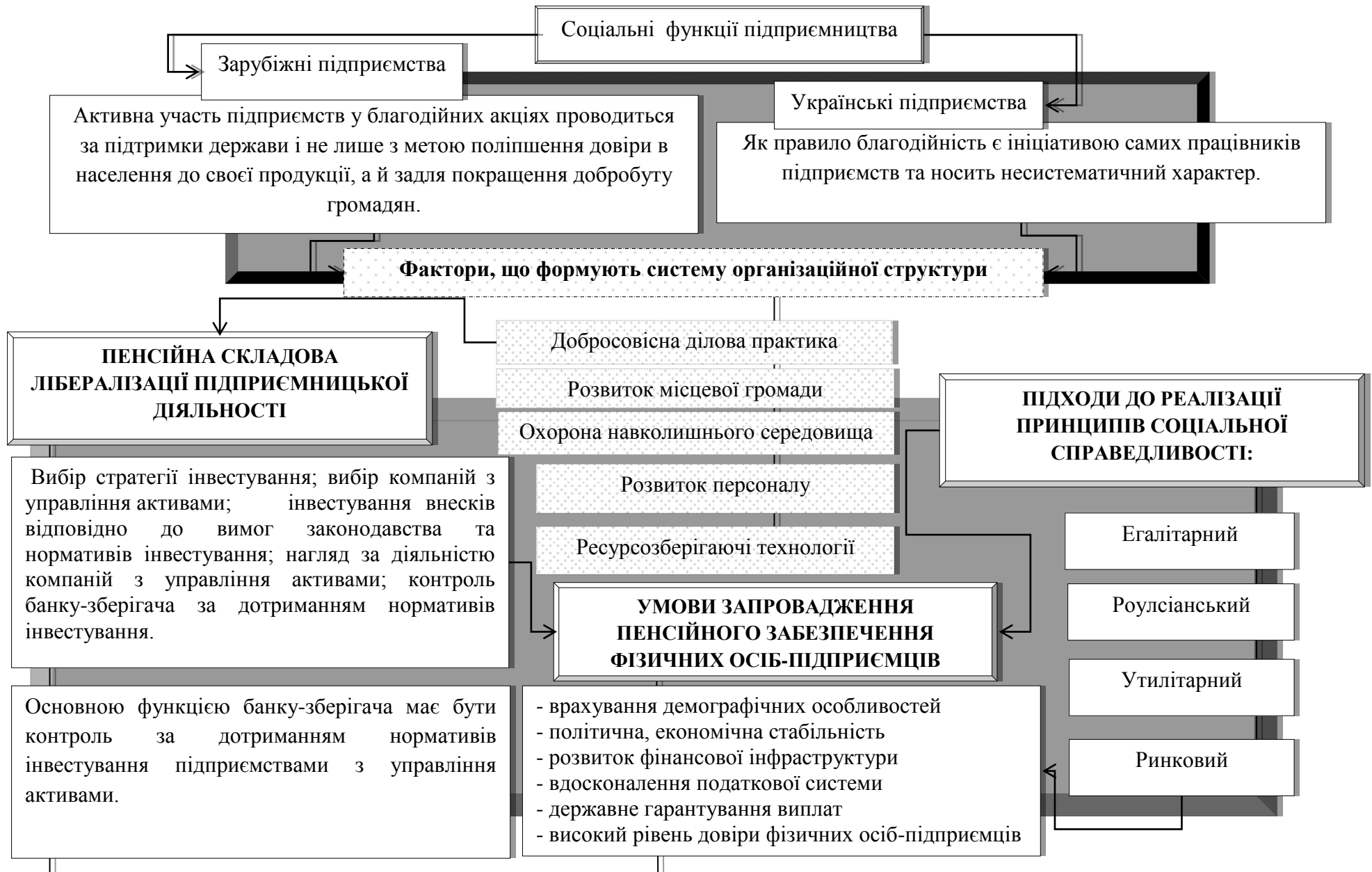
Рис. 1. Соціальні чинники лібералізації підприємницької діяльності