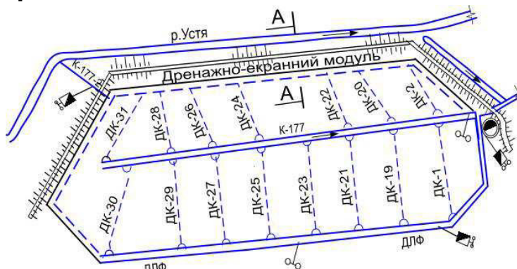
Рис. 3. Фрагмент польдерної системи з влаштуванням захисту від підтоплення за допомогою ДЕМ

Для усунення недоліків щодо ефективного перехоплення ґрунтових вод, що надходять з боку річки-водоприймача і з метою захисту території польдерної системи від підтоплення і надійного її функціонування та посилення берегозахисних функцій дамби в комплексі із збереженням екологічного стану прилеглих територій нами запропоновано замість відкритого каналу вздовж захисної дамби (рис. 3 і рис. 4) влаштовувати конструкції дренажно-екранних модулів (ДЕМ) [1; 2].