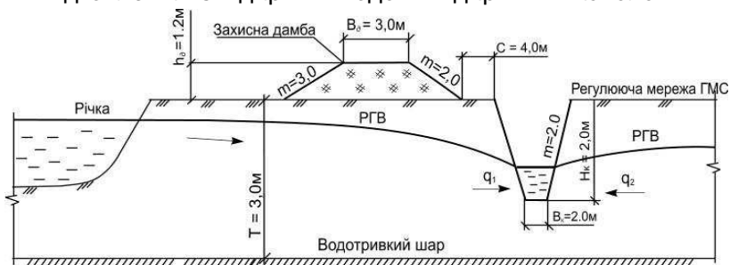
Рис. 2. Схема регулювання притоку ґрунтової води з відкритих водойм на польдерній системі (на перетині А-А, див. рис. 1) за допомогою відкритих каналів

Необхідно відмітити, що надходження надлишкових вод збоку прилеглих територій є вагомою причиною надлишкового зволоження, вона підсилює дію інших факторів, і тому огорожувальна мережа є необхідною частиною більшості осушувальних систем. Нагірно-ловильні канали, використовуються також, вздовж верхньої межі осушуваної території, у місцях інтенсивного припливу поверхневих