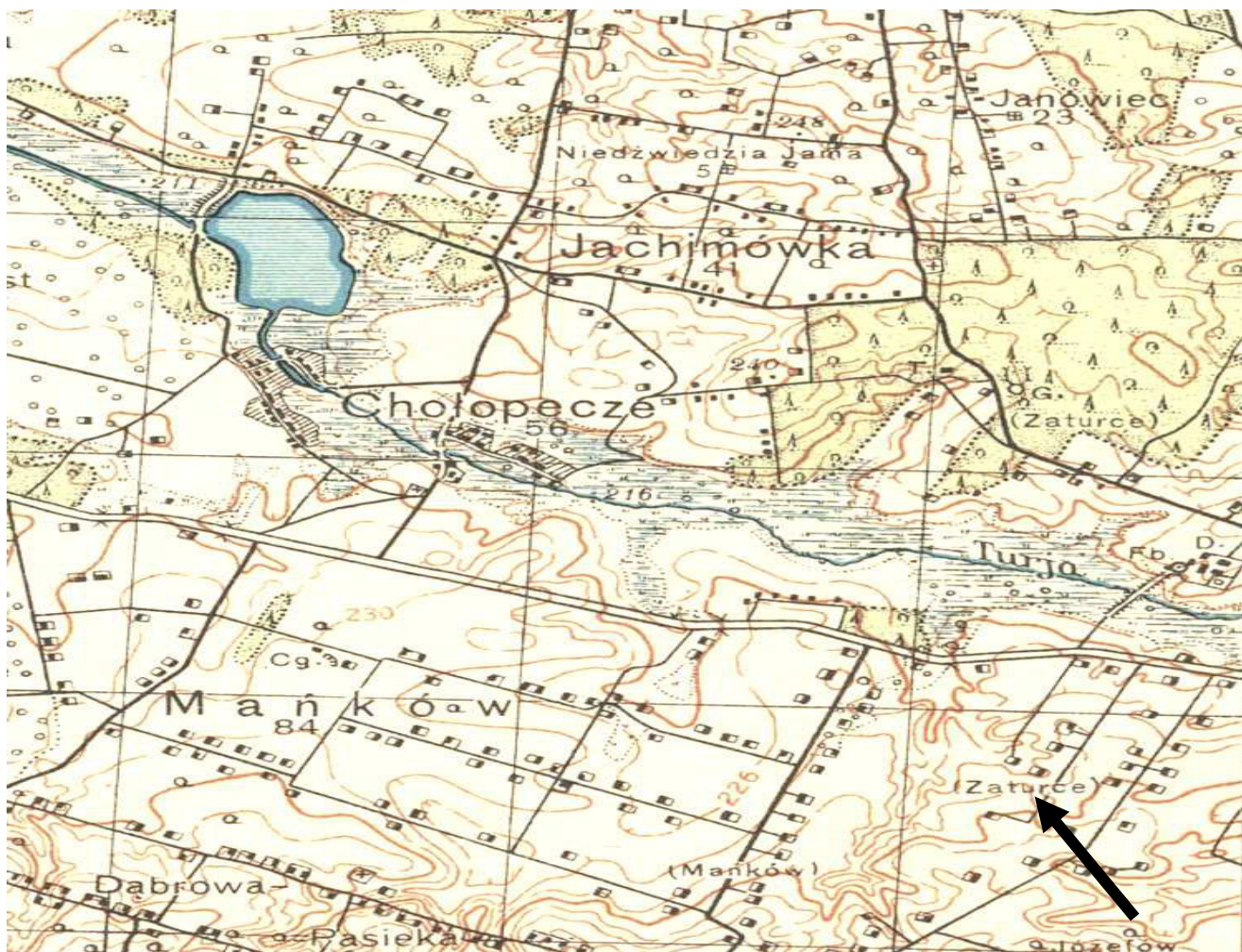
Рис. 1. Верхів'я р. Турії на польській карті 20 – 40-х років XX століття Військового інституту географії