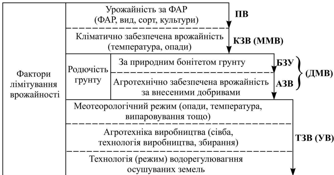
Рис. 1. Класифікація категорій врожайності (за Х.Г. Тоомінгом)

ПВ - потенційна врожайність; КЗВ - кліматично забезпечена врожайність; ММВ - метеорологічно можлива врожайність; БЗУ - урожайність, забезпечена природним бонітетом ґрунту; АЗВ - агротехнічно забезпечена врожайність; ДМВ - дійсно можлива врожайність; ЗВ - технологічно забезпечена врожайність; УВ - урожайність виробництва.