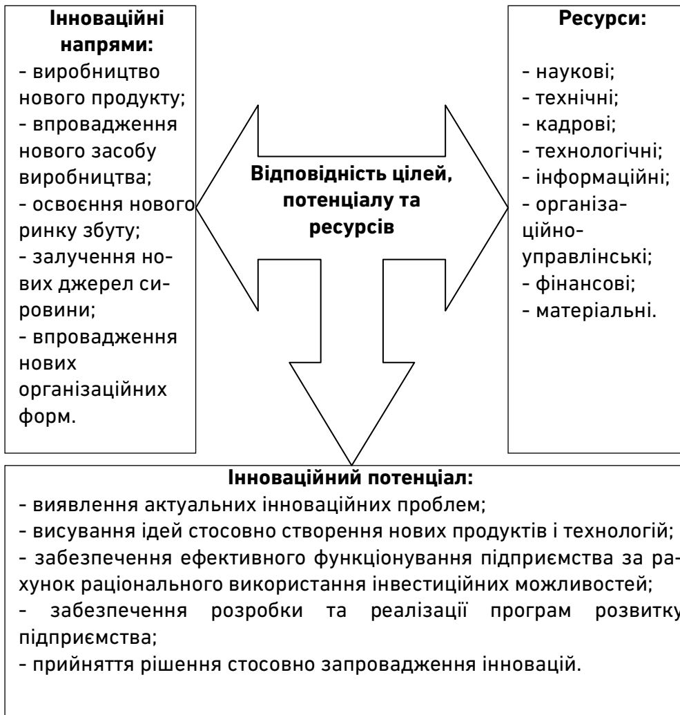
Рис. 2. Формування інноваційного розвитку будівельного підприємства у взаємодії інноваційного потенціалу та ресурсної бази [авторська розробка]

класифікацією інновацій, розробленою Й. Шумпетером [10]), інноваційного потенціалу та ресурсної бази будівельного підприємства подано на рис. 2.