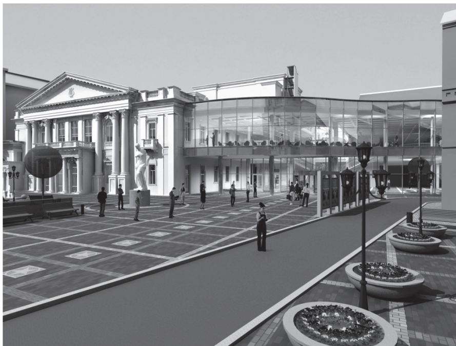
Рис. 1 Общий вид здания

Новая входная часть здания – это красивый атриумный объем с антресолями, связанный со вторым уровнем фойе большого зала и зоной гардероба. Включение в интерьер нового пространства сохраняемых элементов фасадов будут усиливать образное единство старых и новых элементов комплекса.