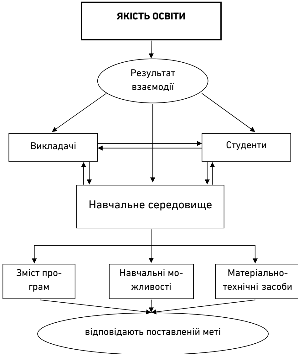
Рис. 1. Структура поняття якості освіти

розвитку та вирішенні щоденних питань керується стандартами, принципами та положеннями, описаними Стандартами та рекомендаціями щодо забезпечення якості у Європейському просторі вищої освіти.