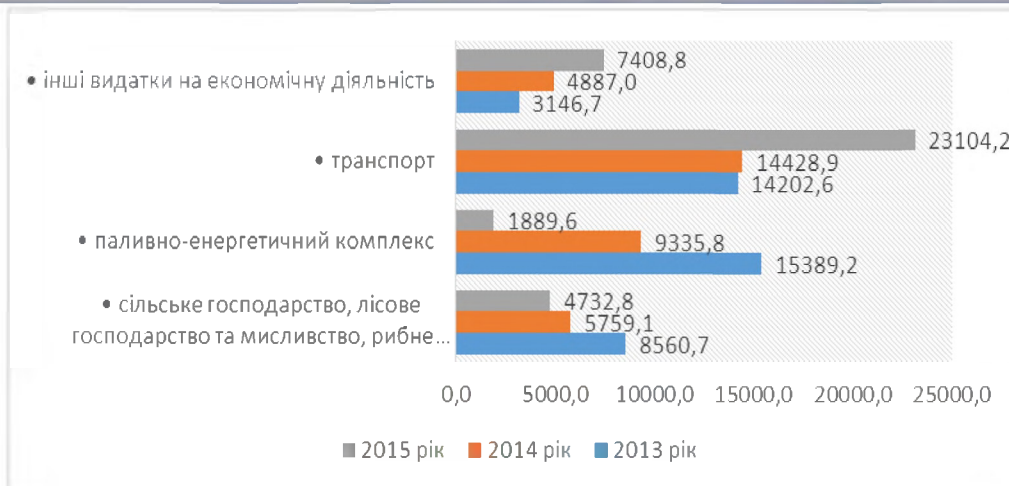
Рис. 2. Видатки державного бюджету України на економічну діяльність у 2015 році

Як свідчать дані, відображені на рисунку 2, у 2015 році, порівняно з попередніми періодами значно збільшились витрати на транспорт (60%) та видатки на інші види економічної діяльності (52%). Разом з тим, на 18% скоротились витрати на сільське господарство і на 80% – на паливно-енергетичний комплекс.