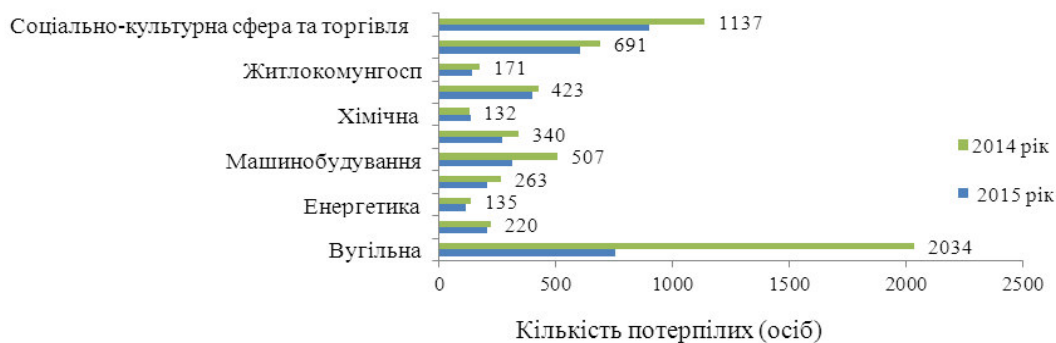
Рис. 2. Порівняльний розподіл страхових нещасних випадків за найбільш травмонебезпечними галузями економіки підприємств за 2014-2015 роки

Найбільша кількість нещасних випадків виробничого характеру спостерігається в Дніпропетровській, Донецькій, Запорізькій, Луганській, Львівській областях та в м. Києві [1]. Найбільш травмонебезпечні галузі економіки за 2014-2015 роки наведено на рис. 2.