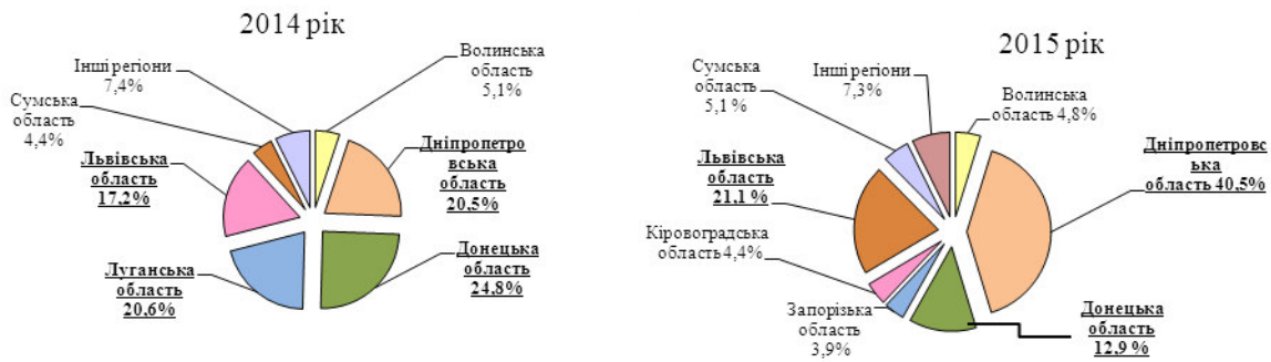
Рис. 3. Кількість професійних захворювань по регіонах України за 2014-2015 роки

зазначити, що протягом 9 місяців 2016 року кількість цих захворювань зменшилася на 18,9%, або на 248 випадків (1313–1065).