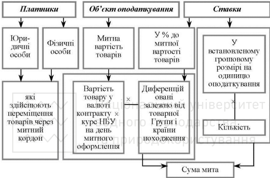
Рис. 6.2 Структурно-логічна схема мита

3) Мито є непрямим податком, що стягується з товарів, які переміщуються через митний кордон країни. Воно характеризується схемою, наведеною на рис.6.2.