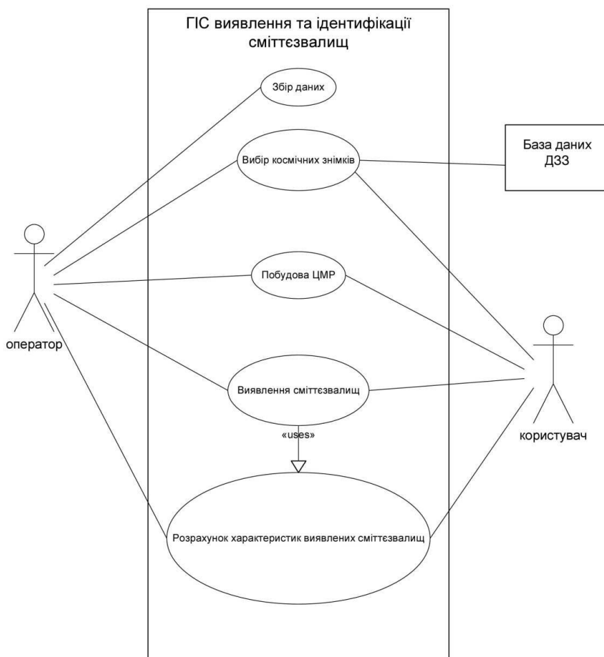
Рис. 1. Процес моделювання загальної системи виявлення та ідентифікації сміттезвалищ

фікації сміттезвалищ та успішного результату, за допомогою універсальної мови моделювання UML, а саме за допомогою діаграми сценаріїв виконання (прецедентів).