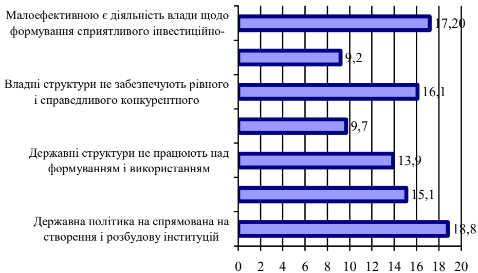
Рис. 2. Результати оцінювання недоліків системи державного регулювання формування і розвитку інвестиційно-інноваційного забезпечення економічної безпеки економіки Львівської області, станом на 2016 р., (розраховано за результатами експертного опитування)

жавного регулювання формування і розвитку інвестиційно-інноваційного забезпечення економічної безпеки держави (рис. 2) зроблено наступні висновки.