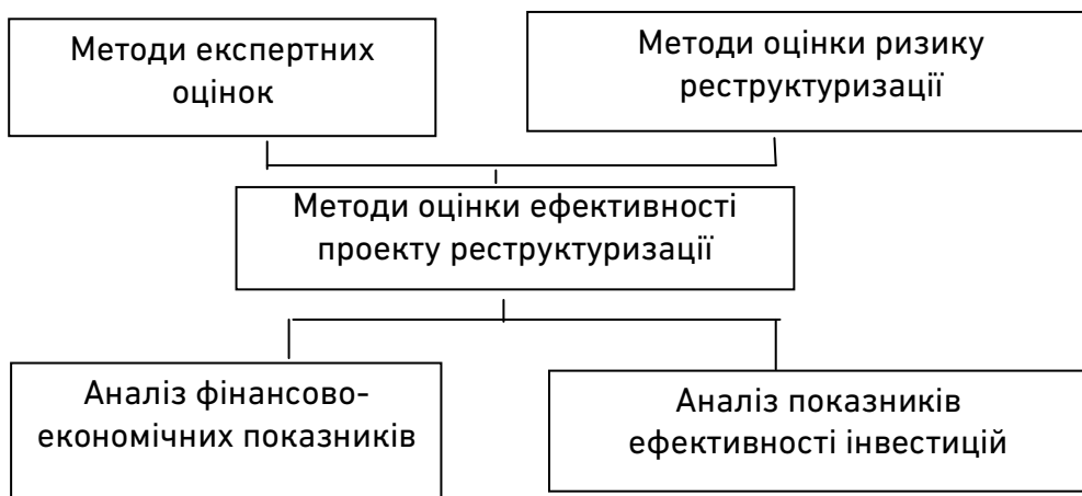
Рис. 2. Методи оцінки ефективності проекту реструктуризації

сті факторів і визначається значною кількістю критеріїв. Всі показники ефективності є мірою ступеня досягнення цілей інвестиційного проекту реструктуризації, тобто відповідності реального і необхідного його результату. Будь-який показник ефективності задається як деяка функція, за значенням якої судять про ефективність інвестиційного проекту; всі вони комплексно застосовуються при виборі найбільш прийняттого варіанту інвестиційного проекту. Таким чином, дослідження ефективності як економічної категорії стосовно інвестиційного проекту реструктуризації носить комплексний характер. Незважаючи на складність і багатогранність процесу реструктуризації виділяють основні методи оцінки її ефективності (рис. 2).