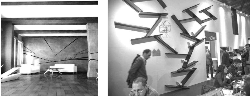
Рис. 2. Приклади рішень інтер'єрів в стилі деконструктивізму

Можливо це одна із причин, через яку деконструктивізм мало поширений в архітектурі та мистецтві України, і зустрічається лише в поодиноких рішеннях інтер'єрів (рис. 2). Для створення подібних об'єктів потрібна належна підготовка та фінансова підтримка професійних кадрів з боку держави, допомога молодим архітекторам, які можливо знаходяться в творчому пошуку і здатні принести щось нове в архітектуру. Прикладом такої політики є провідні країни світу, що вже мають зразки деконструктивізму в будівництві та активно продовжують його розвивати, зокрема: США, Німеччина, Іспанія, Ав-