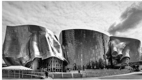
Рис. 1. Приклади споруд в стилі деконструктивізму:

1 – Королівський музей провінції Онтаріо в Торонто; 2 – кінотеатр UFA-Palast в Дрездені; 3 – музей Гугенхайма в Більбао; 4 – музей музики в Сієлі