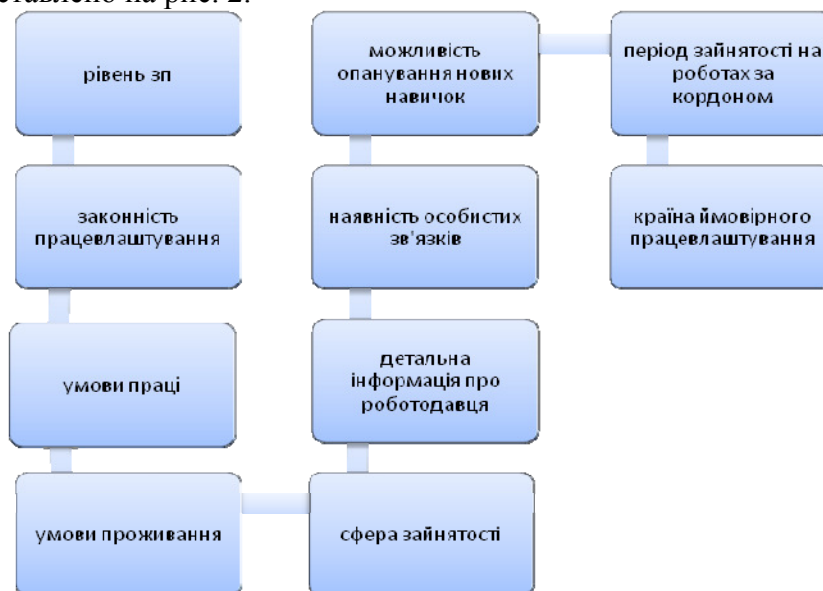
Рис. 2. Найбільш вагомими чинниками, що впливають на прийняття рішення про роботу за кордоном [3]

Найбільш вагомими чинниками, які впливають на прийняття рішення про роботу за кордоном, представлено на рис. 2.