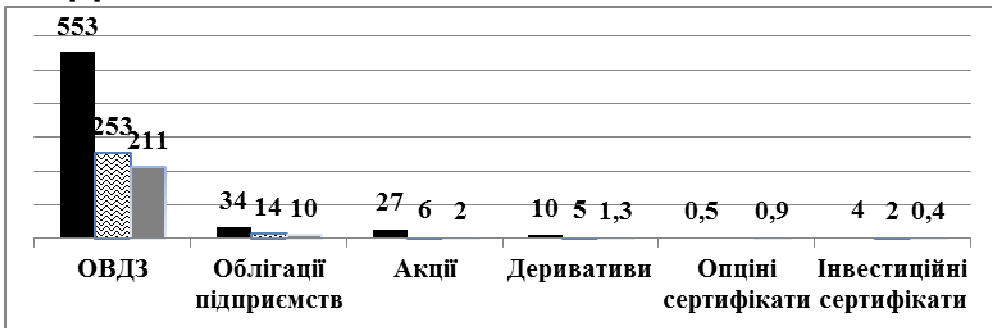
Рис. 2. Обсяги торгів на біржовому фондовому ринку України за видами цінних паперів в 2011–2016 рр., млрд грн (розроблено автором на основі [1])

Організований ринок за структурою обсягів торгів в розрізі фінансових інструментів фактично є ринком державних облігацій (94% загального обсягу) (рис. 2). Характерним є те, що у 2016 році зменшились торги державними цінними паперами, але у порівнянні з іншими інструментами, зменшення було несуттєвим. Обсяг торгів акціями збільшився більш ніж вдвічі, деривативами – в 4 рази, інвестиційними сертифікатами – в 5 разів. Що стосується торгівлі акціями, то 99,5% загального обсягу торгів з акціями відбувається на позабіржовому ринку. Найбільш активно на позабіржовому ринку торгуються цінні папери, торгівля якими була зупинена на фондових біржах [1].