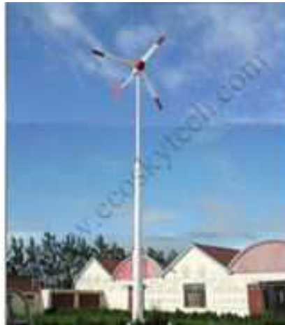
Рис. 4. Вітрогенератор серії W

Для живлення пристроїв вузла аерації пропонується виконувати за рахунок відновлюваних джерел енергії. Зокрема, можна використати вітрогенератори невеликої потужності (рис. 4). Вітчизняна промисловість випускає доволі широкий спектр вітрових електростанцій.