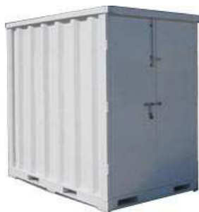
Рис. 5. Контейнер для розміщення обладнання

В комплексі заходів, що передбачається здійснити для поліпшення екологічного стану озера Басів Кут нами пропонується періодично виконувати біохімічне очищення води в озері.