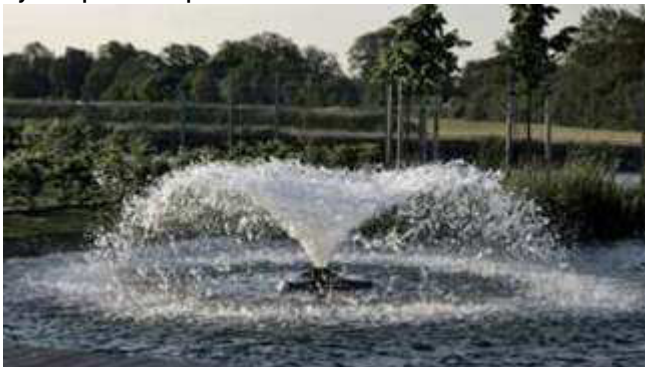
Рис. 1. Аераційний фонтан

Найбільш дієвим і розповсюдженим способом аерації є влаштування на дзеркалі водойми фонтанів (рис. 1), що за рахунок подачі струменю води на певну висоту і падіння його у товщу води здійснює гравітаційне перемішування водних мас і доставку в них кисню захопленого у шарі повітря.