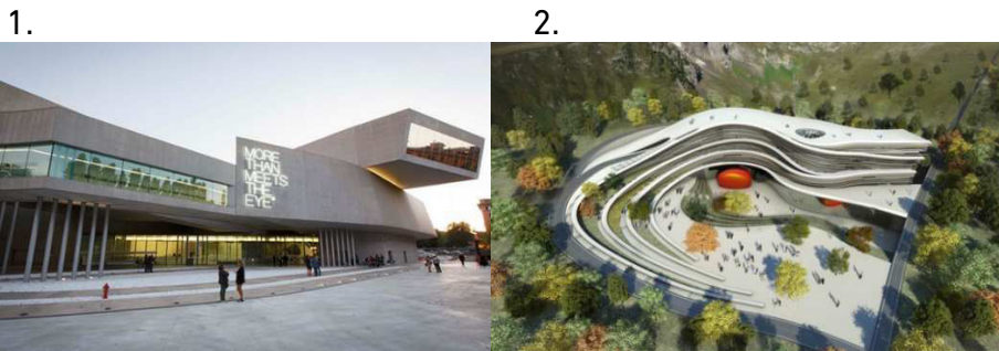
Рис. 3. Проекти Оділь Декк: 1 – музей сучасного мистецтва в Римі; 2 – музей геології і антропології В Нанкіні

У далекому 1985 році разом з французьким архітектором і своїм нареченим Бенуа Корнетом вона відкрила паризьке бюро. Сьогодні Оділь проектує все – від інтер'єрів квартир до аеропортів [5].