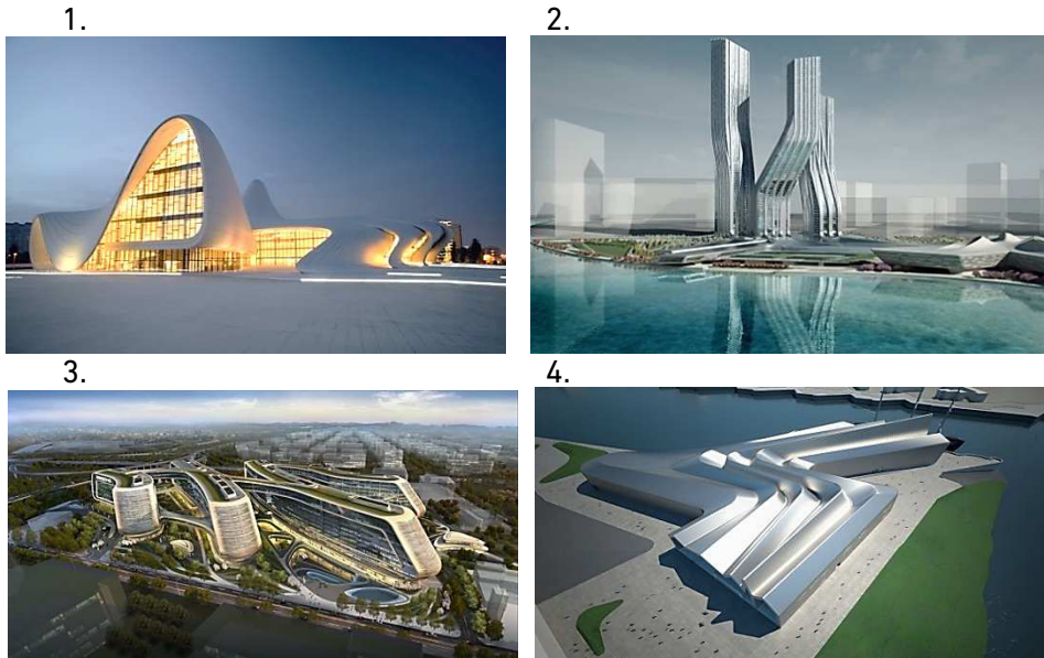
Рис. 1. Найвідоміші роботи Захи Хадід: 1 – центр Гейдара Алієва в Баку; 2 – багатофункціональний комплекс Signature Towers в Дубаї; 3 – багатофункціональний комплекс Sky SOHO у Шанхаї; 4 – музей транспорту Riverside в Глазго

Карме Пінос – представниця іспанської архітектури. Вона викладач Гарварду, Колумбійського університету, Політехнічної школи в Лозанні, Академії архітектури в Мендрізіо.