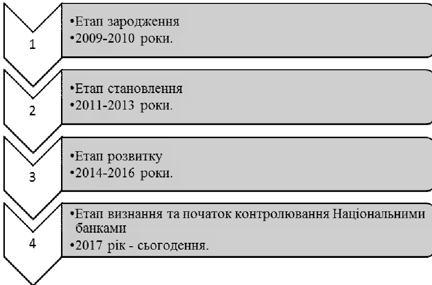
Рис. 3. Етапи розвитку криптовалют

Еволюцію розвитку криптовалют можна зобразити у вигляді декількох етапів, зображених на рис. 1.