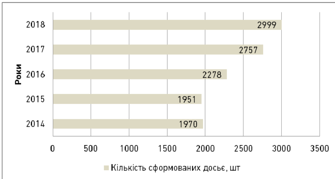
Рис. 3. Динаміка формування досьє за результатами фінансового моніторингу у 2014-2018 рр.