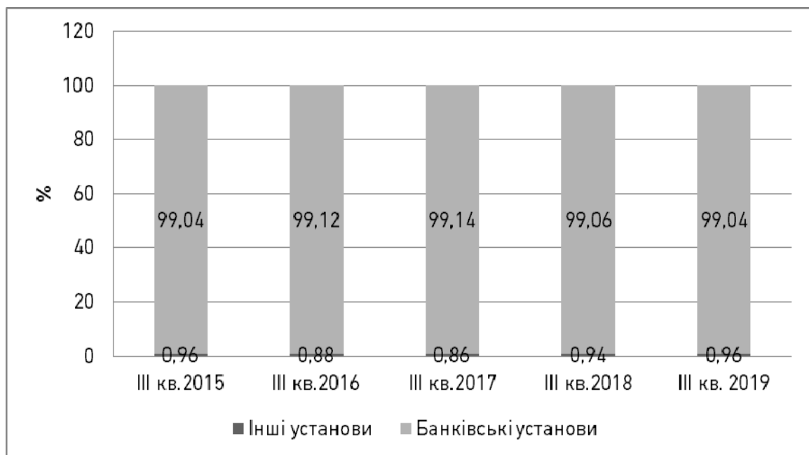
Рис. 1. Структура суб'єктів системи фінансового моніторингу, що надавали інформацію органам ДСФМУ в 2015-2019 рр.

Проте ДСФМУ проводить аналіз отриманих даних та відбирає лише деякі з них для проведення активної роботи. І хоча кількість надісланих повідомлень зросла, частка повідомлень, що підлягають активному опрацюванню з боку Держфінмоніторингу, дещо зменшилася.