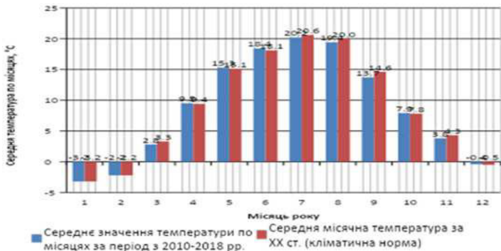
Рис. 2. Діаграма середньої місячної температури повітря

річна температура у порівнянні з даними ХХ ст. теж зросла на 0,5-3,5° С. Особливе підвищення максимальних температур спостерігається у зимовий період року від 1,3° С до 3,5° С. Мінімальні показники температур у плані підвищення теж не відстають від максимальних. Підвищення мінімальних температур сягає від 0,9° С до 4° С, як і в попередньому випадку найбільші показники підвищення мінімальної температури зафіксовані у зимовий період від 1,8 до 4° С. Доволі цікаві показники абсолютних мінімумів, дані показники стали «теплішими», наприклад у січні ХХ ст. абсолютний мінімум становив –1,8° С, а в період з 2010–2018 рр. він підвищився до –21,8° С, тобто збільшився на 10° С. Також, зросла повторюваність спекотних днів в травні, липні та вересні, а у зимовий період зменшилась кількість днів з низькою температурою, особливо в грудні та лютому.