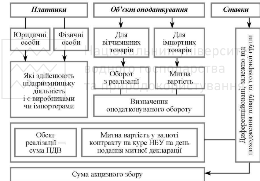
Рис. 11.1 Структурно-логічна схема акцизного збору

Платниками акцизного збору є національні виробники підакцизних товарів та суб'єктів, що імпортують чи реалізують ці товари.