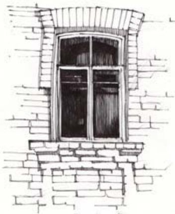
Рис. 2. Вікно з лучковою перемичкою (с. Гільча Друга) Прорис по фото І. Омельчук

а) с. Гільча Друга, вул. Першотравнева, буд.56а; б) с. Гільча Друга, вул. Першотравнева, буд.65а; в) с. Урвенна вул. Жовтнева буд. 50; г) с. Гільча Друга, вул. Першотравнева, буд. 75. Прорис по фото І. Омельчук