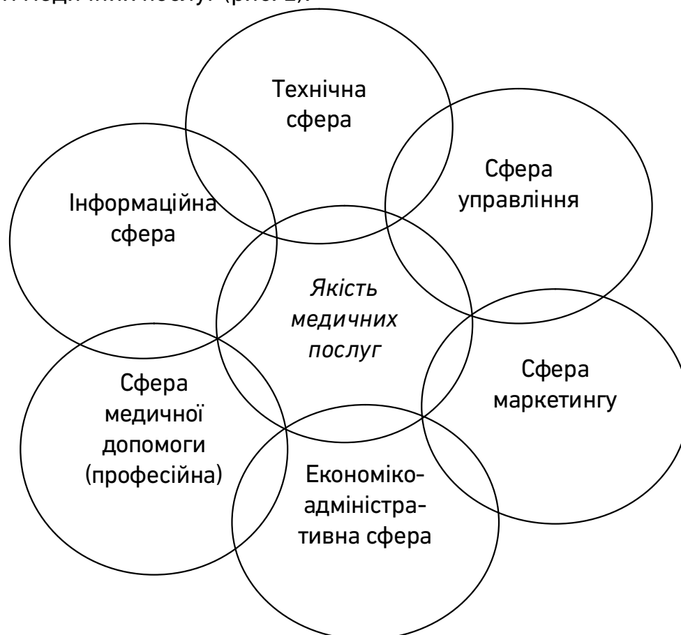
Рис. 2. Сфери забезпечення якості медичних послуг в закладах охорони здоров'я

Медична послуга має досить різнобічну структуру. Тому, оцінюючи якість такої послуги, слід брати до уваги як медичні, так і немедичні аспекти, які на неї впливають. Науковці виділяють наступні сфери, які здійснюють найбільший вплив на формування якості медичних послуг (рис. 2):