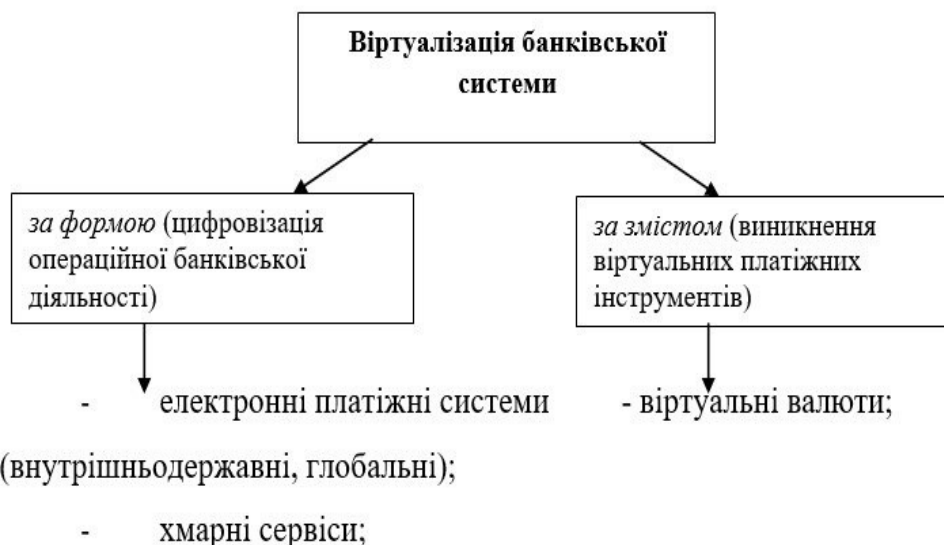
Рис. 2. Схематичне вираження віртуалізації банківської системи

Цифровізація, діджиталізація та віртуалізація світової банківської системи швидко переорієнтувалась на економіку 4.0 і на сьогодні ґрунтується на плануванні роботи банківської системи з запровадженням інформаційних технологій у банківський сектор; за формою можна вважати, що це трансформація банківського сектору в електронний режим функціонування, що вилилось у наступні форми: хмарні сервіси, електронний банкінг, розвиток електронних платіжних систем (внутрішні, міжнародні). Зміст віртуалізації – це поява нових віртуальних інструментів, прикладом яких на цьому етапі соціокультурного розвитку є віртуальні схеми розрахунків, віртуальні валюти, відмінні від електронних грошей. Для наочності представимо на рис. 2 віртуалізацію банківської системи, яка включає два рівні: віртуалізація операційної діяльності (за формою) та вищий рівень – виникнення нових віртуальних інструментів розрахунку (за змістом) (рис. 2).